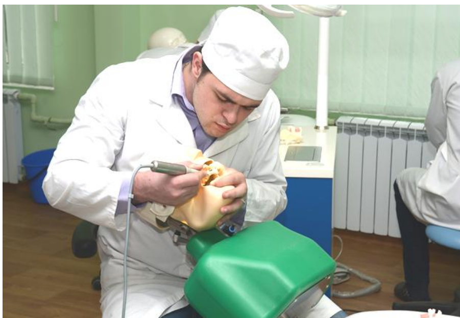
Рис. 1. Робота студентів у фантомному класі на дентальних симуляторах.

Цілеспрямоване зміцнення матеріально-технічної бази кафедри для створення лікувального академічного закладу нового типу, комп'ютерних класів і спеціальних класів, обладнаних сучасними фантомами (Dental Simulator Ajax AJ16) (рис.) та іншими навчально-наочними приладами для відробки практичних навичок та вмій дозволяє на початковому етапі забезпечити формування вмій та практичних навичок у студентів на фантомах, а на другому – оволодіти практичними вміннями лікування основної хірургічної патології відповідно до вимог державного стандарту вищої медичної освіти (схема 2).