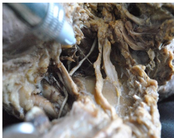
Рис. 3. Отпрепарированы щечный, нижнеальвеолярный и язычный нервы.

Аналогично располагается и язычный нерв, который прилегает к кости на уровне нижнечелюстного отверстия, несколько медиальнее и далее идет по внутренней поверхности нижней челюсти (рис. 3).