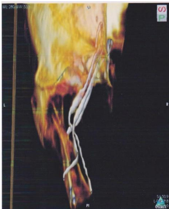
Рис. 1. Визуализация расположения целевых нервов относительно костных структур в области депо анестетика при мандибулярной анестезии (томограмма).

Часто индивидуальные анатомические, физиологические и поведенческие особенности пациента усложняют проведение мандибулярной анестезии, тем самым снижая ее эффективность. Анатомия ориентиров для вкола иглы является вельма вариабельной. Существенно может отличаться толщина и плотность медиальной крылоподобной мышцы, связки, величина клетчаточных пространств, положение языка и т.д. Также далеко не все пациенты могут удерживать широко открытый рот во время проведения анестезии, у части больных выражен рвотный рефлекс.