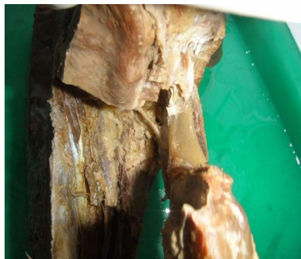
Рис. 2. Сагитальный распил головы человека. Расположение нижнеальвеолярного нерва и артерии до входа в нижнечелюстной канал.

ностей положения целевых нервов, особенно нижнеальвеолярного и язычного, а также нижнеальвеолярной ветви верхнечелюстной артерии имеет важное клиническое значение. Следует подчеркнуть, что, вопреки распространенным среди стоматологов представлениям об анатомическом строении данной области, ни нижнеальвеолярный нерв, ни соответствующая артерия не идут "по кости". С нижней челюстью они впервые соприкасаются только при входе в нижнечелюстной канал, приближаясь к нижнечелюстному отверстию под углом около 45 градусов (рис. 1, 2).