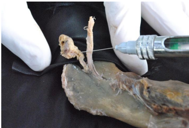
Рис. 4. Положение иглы на целевом пункте мандибулярной анестезии.

лы с костью на 0,5 см выше нижнечелюстного отверстия [7]) нижнеальвеолярный и язычный нервы будут находиться на расстоянии около 1 см от скоса иглы (рис. 3). Соответственно, чем точка контакта иглы с костью выше, тем целевые нервы будут дальше. Известно, что одним из основополагающих принципов всех проводниковых анестезий является концепция "прицельного попадания", чем скос иглы ближе к нерву, тем эффективность анестезии больше. В свою очередь, это обуславливает ряд типичных осложнений для проводниковых анестезий, таких как ранение сосудов и нервов. При проведении мандибулярной анестезии ранение сосуда и нерва возможно при продвижении иглы до ее контакта с костью, а внутрисосудистая инъекция - при прицельном попадании в артерию, которое может состояться только в точке ее входа в воронковую часть нижнечелюстного канала (рис. 4). К этому может привести нарушение методики или атипичное строение данной анатомической области.